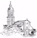
St. Peter und Paul, Freising-Neustift