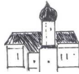
St. Laurentius, Haindlfing