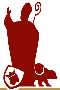
REINHARD KARDINAL MARX Erzbischof von München und Freising