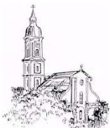
St. Peter und Paul, Freising-Neustift