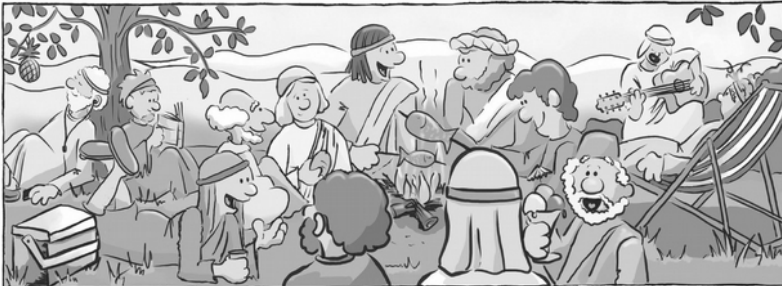
Finde 7 Fehler Jesus und seine Jünger machen Ferien www.WAHNUNTER.de

Aber manchmal reicht ja nicht ein freier Tag, um sich zu erholen. Das wisst ihr ja selbst. Und das war bei Jesus nicht anders. Die Bibel erzählt davon, dass Jesus einmal mit seinen Freunden in eine einsame Gegend gefahren ist, um sich auszuruhen. Seine Freunde – die Jünger – waren vorher in ganz vielen Dörfern gewesen, um den Menschen von Gott zu erzählen, und jetzt waren sie ganz erschöpft. Deshalb fährt Jesus mit ihnen in einem Boot in eine einsame Gegend. Doch das mit den Ferien hat nicht so richtig geklappt. Die Menschen fanden Jesus und kamen zu ihm mit ihren Fragen und Sorgen. Und Jesus kümmerte sich um sie. Ihm waren die Menschen wichtiger als seine Ruhe.