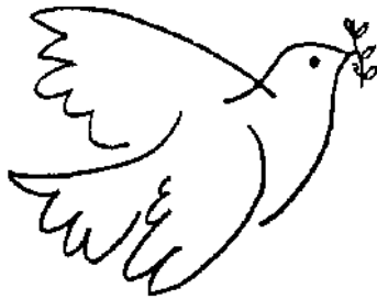
„Paloma de Paz Blanca“ von Pablo Picasso

am Sonntag, 5. August 2018 um 19 Uhr in der Pfarrkirche Maria Himmelfahrt