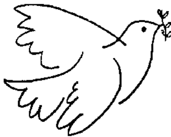
„Paloma de Paz Blanca“ von Pablo Picasso

am Sonntag, 2. September 2018 um 19 Uhr in der Pfarrkirche Maria Himmelfahrt