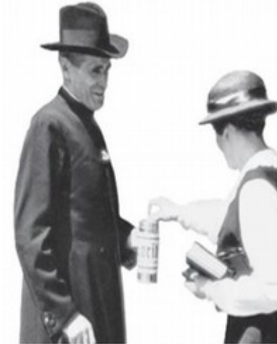
Jesuitenpater Rupert Mayer, Patron der Caritas im Erzbistum, sammelte schon 1935 mit der Caritas-Büchse vor St. Michael in der Münchner Fußgängerzone.

Alle Sammler/innen an den Haustüren sind im Auftrag der Pfarrei unterwegs und können sich ausweisen. In manchen Pfarrgemeinden oder einzelnen Straßenzügen werden auch Sammlungsbriefe eingeworfen.