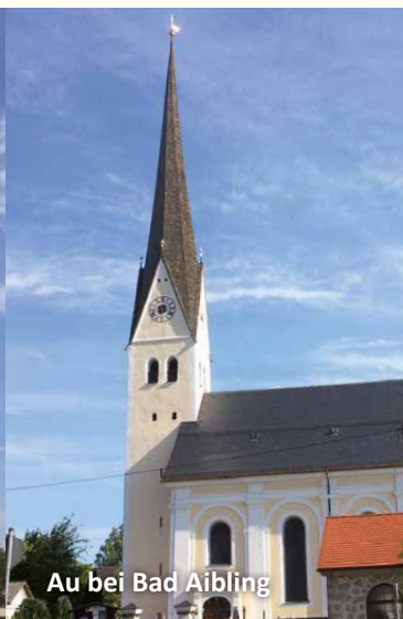
Au bei Bad Aibling