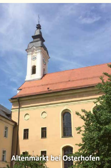
Altenmarkt bei Osterhofen

Unser Ausflugsziel am Dienstag, 9. Oktober 2018 , ist St. Leonhard am Buchat . Jede Epoche angefangen bei der Gotik bis hin zu den Neo-Stilen hat Bemerkenswertes in dieser Kirche hinterlassen. Die ehemalige Wallfahrtskirche St. Leonhard wurde um 1200 erbaut und wiederum Ende des 15. Jahrhunderts auf romanischen Mauern neu errichtet. Die Ausstattung der Kirche geht auf das 17. Jahrhundert zurück und die Bildtafeln eines gotischen Altars auf das Jahr 1500. Die barocken Altäre des 17. und 18. Jahrhunderts sowie Skulpturen des 15. bis 18. Jahrhunderts sind als besonderes Zusammenspiel der Kunstepochen zu beobachten. Am Nachmittag besuchen wir die neu renovierte Kirche St. Martin in Babensham . Der Kirchenbau wurde im 15. Jahrhundert als spätgotischer Saalbau errichtet, wobei Teile des spätromanischen Vorgängerbaus einbezogen wurden. Dieses hohe Alter zeigt sich auch in der Baustruktur, so sind die Achsen von Langhaus und Chorraum gegeneinander. Im 18. Jahrhundert wurde die Kirche im Sinne des reifen Rokoko umgestaltet, wobei der angesehene Burghausener Bildhauer Johann Georg Lindt für die Altarausstattung verantwortlich zeichnete. Abfahrt ist um 8.00 Uhr ab Stephansplatz. Anmeldemöglichkeit besteht ab Mittwoch, 19. September 2018, ab 9.00 Uhr im Pfarrbüro von St. Peter.