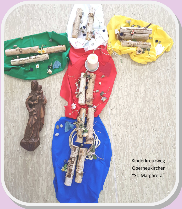
Kinderkreuzweg Oberneukirchen "St. Margareta"