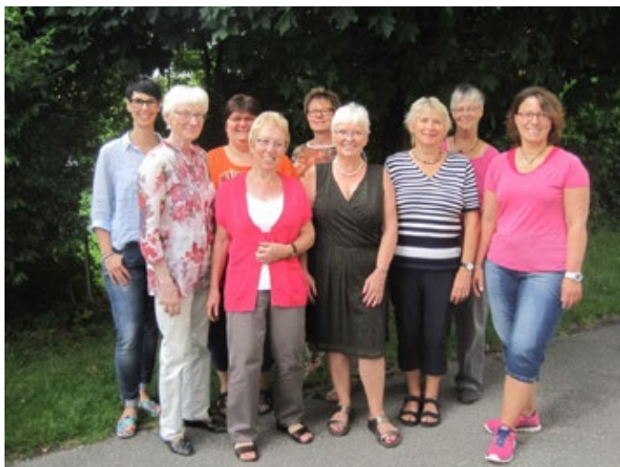
Ihr Bücherei-Team der Bücherei St. Martin Waging am See

Auch in diesem Jahr sind bereits interessante Veranstaltungen in Planung. Wir werden wieder versuchen, Sie mit überraschenden Events und Angeboten zu erfreuen. Bereits im April wird es eine Novitäten-Ausstellung geben, die es in sich hat. Trotz der ziemlich beengten Raumverhältnisse in unserer Bücherei St. Martin versuchen wir diese zu einem willkommenen Treffpunkt für Jung und Alt zu gestalten. Seien Sie neugierig! Wir freuen uns über Ihren Besuch!