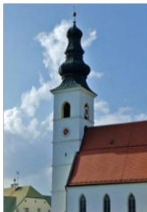
Pfarrei St. Stephanus