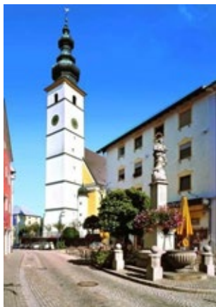
Pfarrei St. Martin