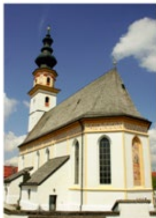
Kuratie St. Leonhard