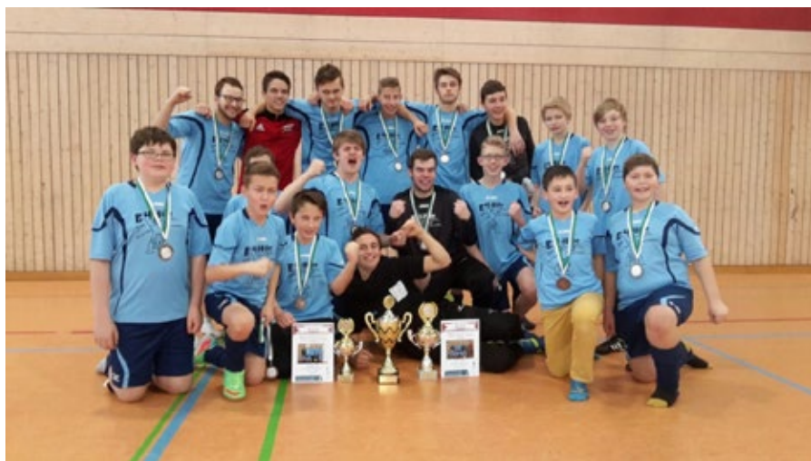
Beide Mannschaften nach dem Landkreisturnier in Traunstein