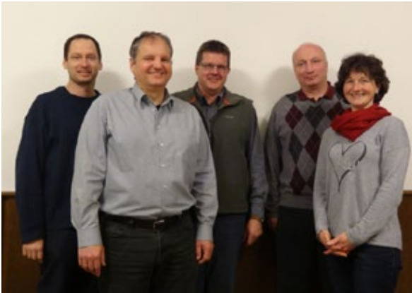
Umweltteam (von rechts)

Zusätzlich zur Benennung des Umweltbeauftragten haben wir in unserer Pfarrei im Dezember ein Umweltteam gegründet.