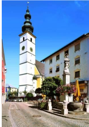
Pfarrei St. Martin