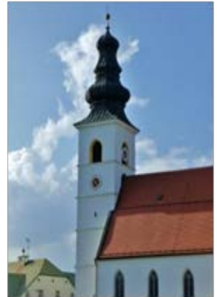
Pfarrei St. Stephanus