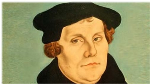
Martin Luther (1483 – 1546)