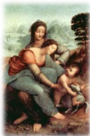
Leonardo da Vinci