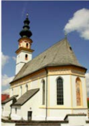
Kuratie St. Leonhard