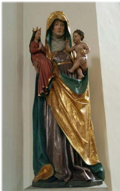
Pfarrkirche St. Georg Freising