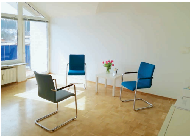
Abbildung 1: Einer der vier Beratungsräume

Im Jahr 2017 stand für die Ehe-, Familien- und Lebensberatungsstelle Bad Tölz-Wolfratshausen neben der Begleitung der Klient*Innen die Suche nach neuen Räumlichkeiten im Vordergrund. Nachdem die Beratungsstelle 29 Jahre in Wolfratshausen angesiedelt war, befindet sie sich seit Dezember 2017 in der Egerlandstraße 76 in Geretsried. Hier haben wir besonders großzügige, gut erreichbare und ruhige Räumlichkeiten gefunden. Durch die Anzahl der Beratungsräume sind wir einerseits bei der Terminvergabe deutlich flexibler. Auf der anderen Seite trägt die aktivierende Atmosphäre der hellen und freundlichen Räumlichkeiten dazu bei, dass sich unsere Klient*Innen und unsere Mitarbeiterinnen wohlfühlen und Veränderungsprozesse motiviert angehen können. Wir freuen uns darauf, weiter in unserer neuen Umgebung anzukommen, uns mit anderen Einrichtungen zu vernetzen und unseren Klient*Innen aus dem Landkreis Bad Tölz-Wolfratshausen weiterhin ein professionelles Beratungsangebot bieten zu können.