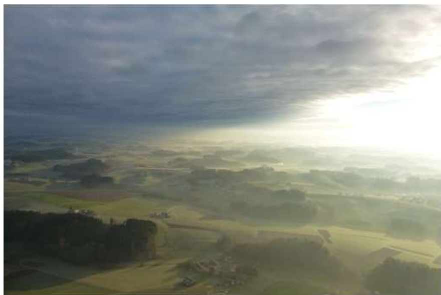
Rottal bei Griesbach