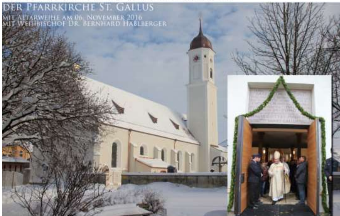
DAS NEUE WESTPORTAL