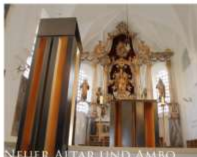
NEUER ALTAR UND AMBO GESTALTET VON DER KÜNSTLERIN FR. SABINE STRAUB