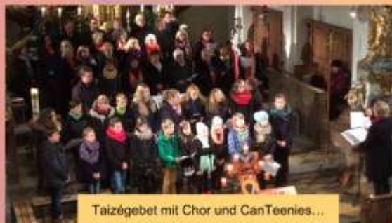
Taizégebet mit Chor und CanTeenies...