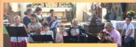
Christi's eifrige Flötengruppe...