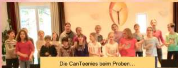
Die CanTeenies beim Proben...