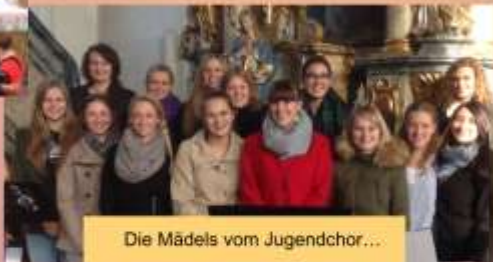
Die Mädels vom Jugendchor...