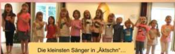
Die kleinsten Sänger in „Äktschn“ ...