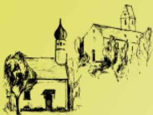
Kath. Pfarrgemeinde St. Vitus, Hochstätt