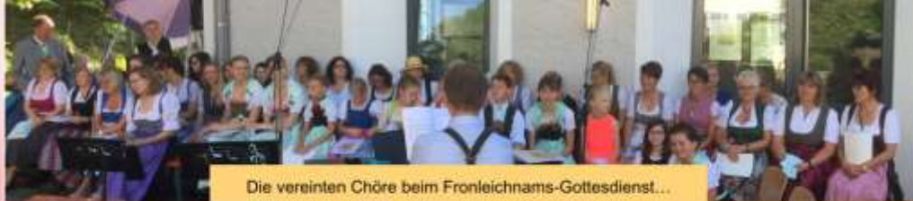
Die vereinten Chöre beim Fronleichnams-Gottesdienst...