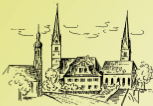
Kath. Pfarrgemeinde St. Laurentius, Pfaffenhofen