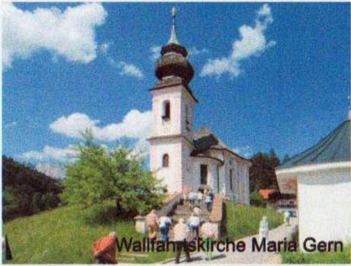
Wallfahrtskirche Maria Gern