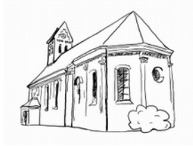
St. Peter und Paul