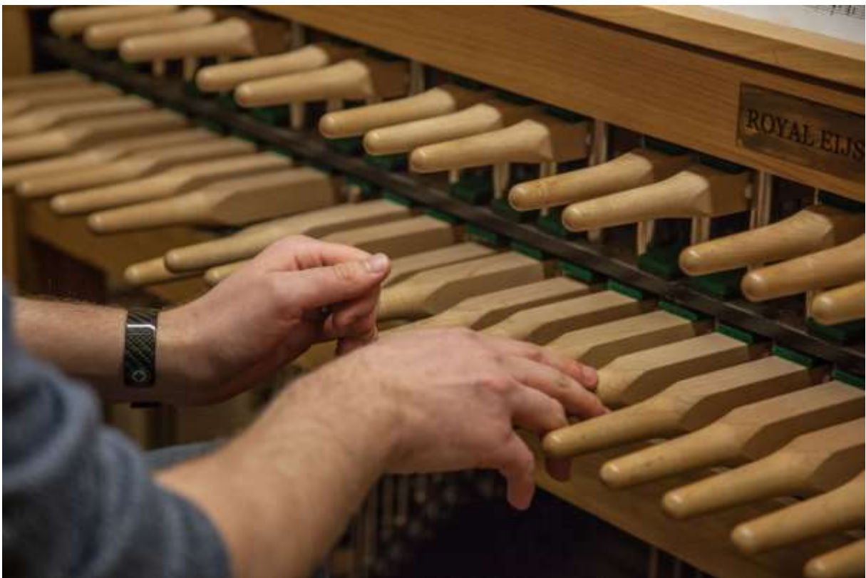
gespielt wird meist mit der offenen Faust