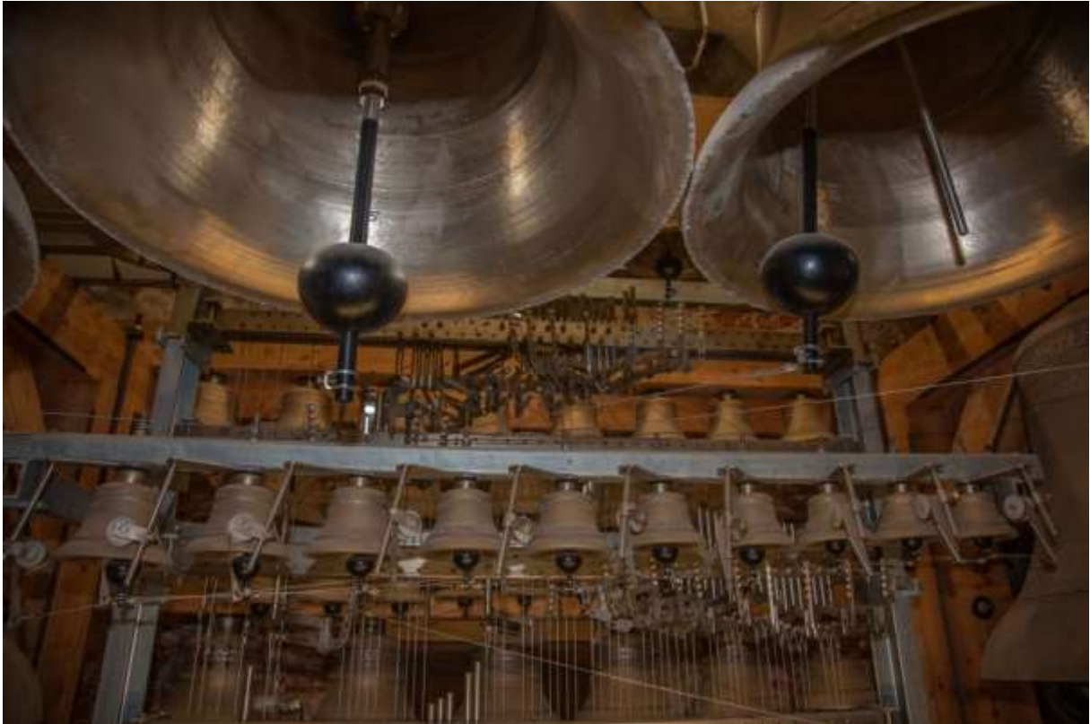
Glocken und Traktur des Carillons im Turm der Mariahilfkirche