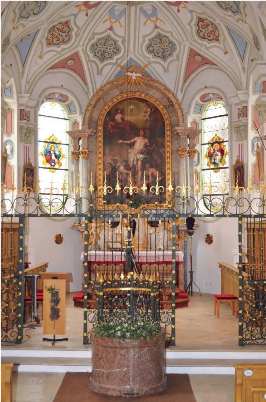
Wallfahrtskirche Hl. Blut in Einsbach