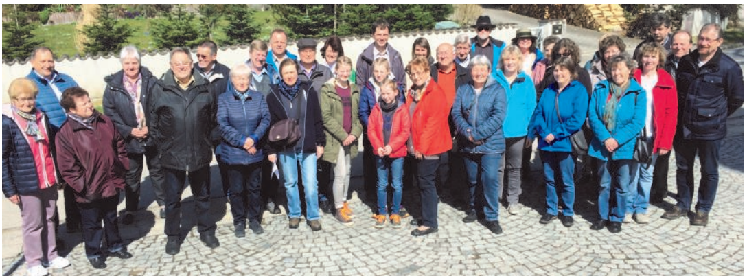
Emmausgang der KAB