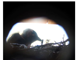
Blick durch die 20mm große Beobachtungsöffnung an der Rückwand.

Aber unser Herr und Schöpfer sorgt für alles – vielleicht schickt er uns die Turmfalken nächstes Jahr!