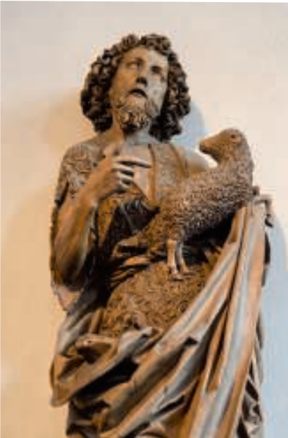
Johannes der Täufer von Tilman Riemenschneider in Haßfurt, St. Kilian

Als Zacharias seine Stimme wieder zurückbekam, wurde er vom Heiligen Geist erfüllt: „Und du, Kind, wirst Prophet des Höchsten heißen; denn du wirst dem Herrn vorangehen und ihm den Weg bereiten“.