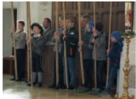
o: Die Buben wetteifern mit ihren Stangen.