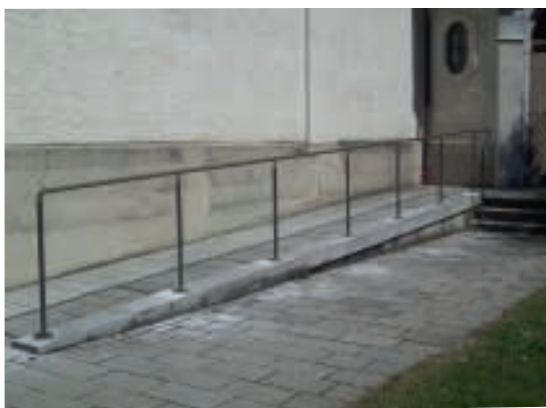
Das Geländer an der Rampe bei der Probeaufstellung

In Kürze werden an der Südseite der Kirche, an der Treppe zur alten Sakristei und an der Freitreppe zum Pfarrhaus hin neue Geländer angebracht, um die Sicherheit zu erhöhen.