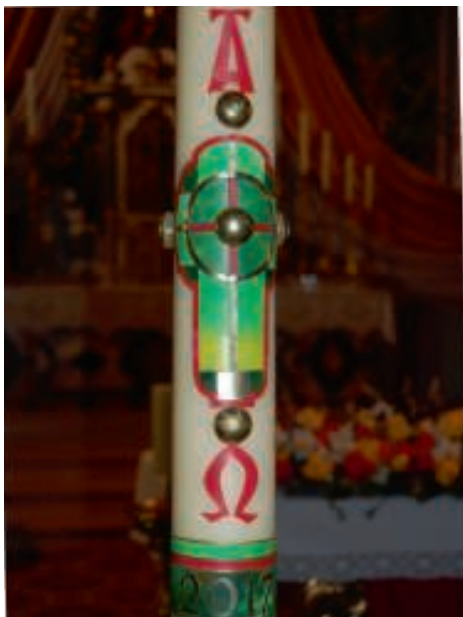
Die Kerze von 2017