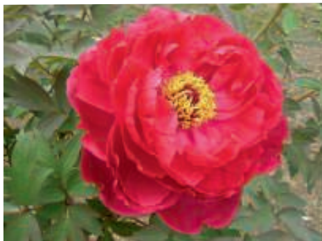
Auch die Pfingstrose, hier Paeonia Suffruticosa „Shima-nishiki“, weist auf die Schönheit der Schöpfung hin.

So ähnlich ist es mit dem Heiligen Geist. Wir sehen ihn nicht, aber wir können sein Wirken erkennen. Er war dabei, als die Welt erschaffen wurde – und wir können auch heute die Schönheit der Schöpfung bewundern. Er ist der Atem, der uns Menschen geschenkt wurde, damit wir leben. Er ist die Weisheit Gottes, von der die Propheten und die Heiligen bezeugen. Durch ihn hat Jesus, das ewige Wort Gottes, Fleisch angenommen. Der Heilige Geist wurde schließlich den Jüngern gesandt, damit sie im Glauben gestärkt, die frohe Botschaft in die ganze Welt tragen können.