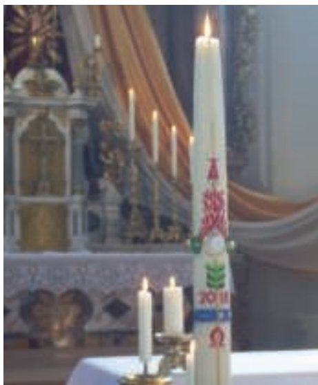
Die Kerze 2018 mit den Sakramentensymbolen

finden sich in der Pfarrkirche Kiefersfelden. In der frühen Kirche durchwachte man die Nacht zum Ostersonntag und zündete am Beginn zur Erleuchtung eine Kerze an. Anknüpfung war das Brandopfer, das antiken Gottheiten, verbunden mit einem Gesang dargebracht wurde. Zum Hymnus wurde das österliche „Exsultet“, benannt nach dem Anfangswort „Frohlocke“. Der Einzug erinnert auch an die Feuersäule, mit der Gott die Israeliten durch die Wüste und das Schilfmeer begleitete. Ursprünglich wurde die Kerze nur mit Blumen geschmückt, Zeichen für den von Gott neu geschaffenen Baum des Lebens.