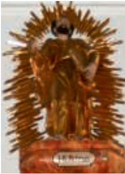
Petrus in Oberaudorf,

Mit reifen Kirschen füllt die Schüssel, Sankt Peter mit dem Himmelschlüssel.