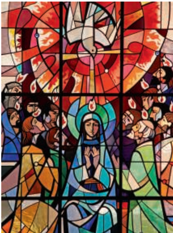
Glasfenster in der Aloysius-Kirche in Somers Town, London