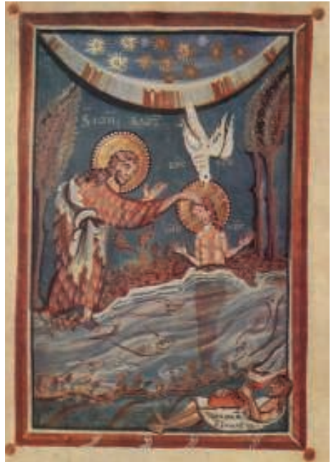
Taufe Jesu im Hitda-Evangeliar

Johannes rief alle zur Umkehr auf. Er ermahnte die Zöllner und Soldaten. „Verlangt nicht mehr, als festgesetzt ist“ und „misshandelt niemanden“. Er wandte sich aber auch an die Pharisäer und Sadduzäer. „Ihr Schlangenbrut, bringt Frucht hervor, die eure Umkehr zeigt“. „Jeder Baum der keine Frucht bringt wird umgehauen“. Er tadelte Herodes wegen seines Lebenswandels. So wurde