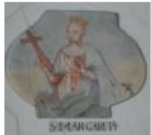
Deckengemälde in Oberaudorf

Bringt Margarete Regenzeit, verdirbt die Ernte weit und breit. Margaret bringt heiße Glut, so gerät der September gut.