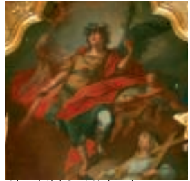
Altarbild St. Michael

Michaelistag, der Älpler Qual, da treiben sie das Vieh zu Tal. Wenn die Vögel nicht ziehen vor Michaeli furt, wird's nicht Winter vor Christi Geburt.