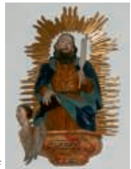
Matthäus in Oberaudorf

Tritt Matthäus stürmisch ein, wird`s ein kalter Winter sein. Ist Matthäus hell und klar, gute Zeiten bringt`s fürwahr.