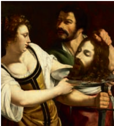
Salome mit dem Haupt des Johannes, von Artemisia Gentileschi, ca 1610

er gefangen genommen und in den Kerker geworfen. Aus diesem heraus ließ er durch Boten bei Jesus anfragen. „Bist du der, der kommen soll?“. Jesus sagte über Johannes zu der Menge: „Unter den von einer Frau Geborenen ist kein Größerer aufgetreten als Johannes der Täufer“. Da Johannes bei seinen Vorwürfen gegenüber der Ehe Herodes blieb, ließ dieser ihn auf Wunsch der Tochter von Herodias, enthaupten.