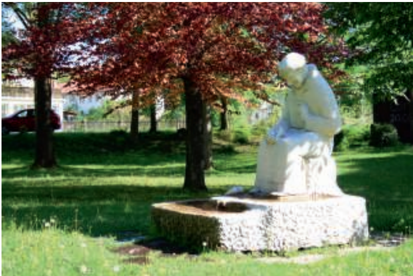
Fest des heiligen Franziskus am 4. Oktober

Sonne an Sankt Franz, gibt dem Wein den Glanz