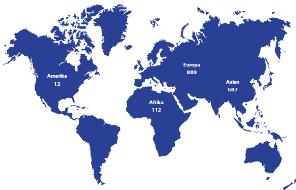
Zahl der ausgereisten Personen nach Kontinenten im Zeitraum 01.01.2015 bis 31.12.2017

Form von Mietkostenzuschuss, Ausbildungsbeihilfe oder Existenzgründungsförderung. Die Angebote der Rückkehrhilfe richten sich nach den individuellen Bedürfnissen und Fähigkeiten der Menschen. So lässt sich der erfolgreiche Neuanfang in der Heimat bestmöglich unterstützen.