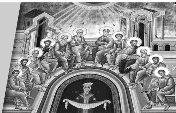
St. Michael, Aachen

Die Ausgießung des Geistes ist nicht auf das erste Pfingsten beschränkt, sondern bleibt bis zum Jüngsten Tag in Gang.