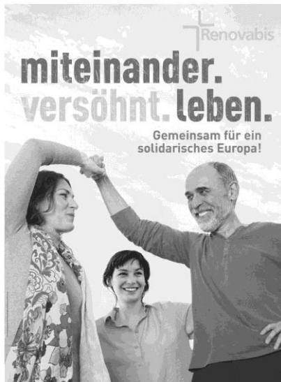
Plingstkollekte am 20. Mai 2018

Das Pfarrbüro St. Stephan ist vom 14.5.- 23.5.2018 wegen Urlaub geschlossen. Vertretung Pfarrei St. Martin, Saaldorf Tel. 9771. Wir bitten um Beachtung