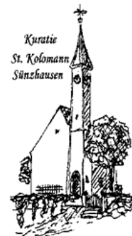
Kuratie St. Kolomann Sünzhausen

Internetseiten im Pfarrverband: www.erzbistum-muenchen.de/PV-Schweitenkirchen www.erzbistum-muenchen.de/Schweitenkirchen www.erzbistum-muenchen.de/MariaeHimmelfahrtFoernbach