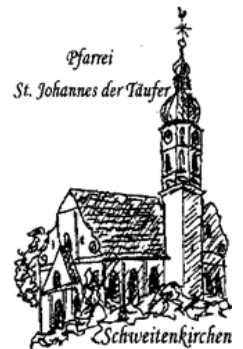
Pfarrei St. Johannes der Täufer Schweitenkirchen