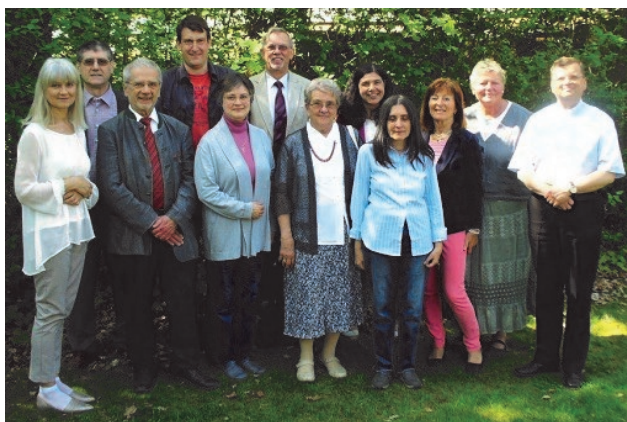
auf dem Foto fehlt Georg Irgmaier