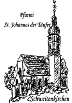
Pfarrei St. Johannes der Täufer Schweitenkirchen