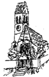
Kuratie St. Georg Dürnzhausen