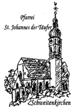
Pfarrei St. Johannes der Täufer Schweitenkirchen