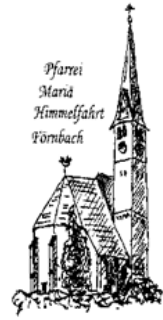
Pfarrei Maria Himmelfahrt Förbach