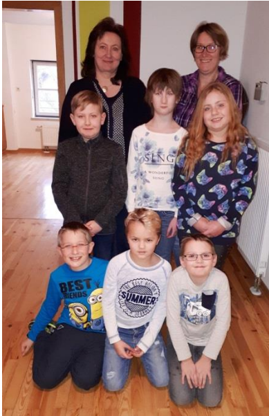
Ranoldsberg und Walkersaich