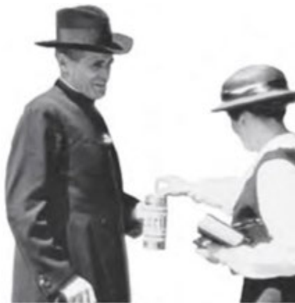
Jesuitenpater Rupert Mayer, Patron der Caritas im Erzbistum, sammelte schon 1935 mit der Caritas-Büchse vor St. Michael in der Münchner Fußgängerzone.

Die Sammlungsgelder werden für die soziale Arbeit und soziale Aufgaben vor Ort verwendet. 40 Prozent verbleiben in der Pfarrgemeinde und 60 Prozent gehen an die örtliche Caritas im Landkreis, die damit Menschen in Not unterstützt und Dienste finanziert, die nicht genügend öffentliche Förderung erhalten.