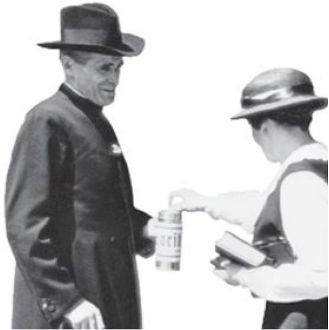
Jesuitenpater Rupert Mayer, Patron der Caritas im Erzbistum, sammelte schon 1935 mit der Caritas-Büchse vor St. Michael in der Münchner Fußgängerzone.

Alle Sammler/innen an den Haustüren sind im Auftrag der Pfarrei unterwegs und können sich ausweisen. In manchen Pfarrgemeinden oder einzelnen Straßenzügen werden auch Sammlungsbriefe eingeworfen.