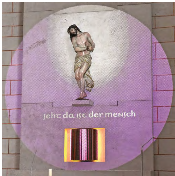
„Ecce Homo“ von Georg Petel im Augsburger Dom im Rahmen einer Lichtinstallation zum Aschermittwoch der Künstler

Reithofen 18.30 Rosenkranz 19.00 Eucharistiefeier