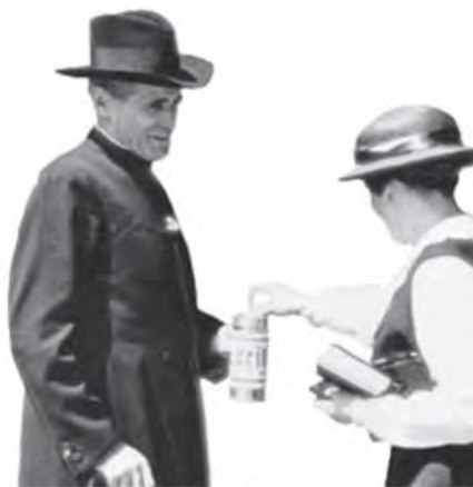
Jesuitenpater Rupert Mayer, Patron der Caritas im Erzbistum, sammelte schon 1935 mit der Caritas-Büchse vor St. Michael in der Münchner Fußgängerzone.

Die Sammlungsgelder werden für die soziale Arbeit und soziale Aufgaben vor Ort verwendet. 40 Prozent verbleiben in der Pfarrgemeinde und 60 Prozent gehen an die örtliche Caritas im Landkreis, die damit Menschen in Not unterstützt und Dienste finanziert, die nicht genügend öffentliche Förderung erhalten.