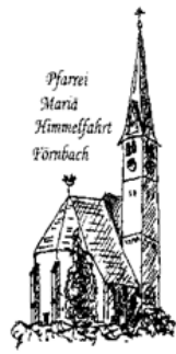
Pfarrei Maria Himmelfahrt Förbach