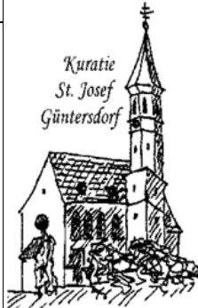
Kuratie St. Josef Güntersdorf