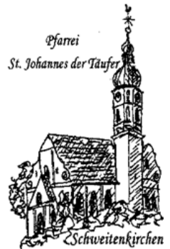
Pfarrei St. Johannes der Täufer Schweitenkirchen