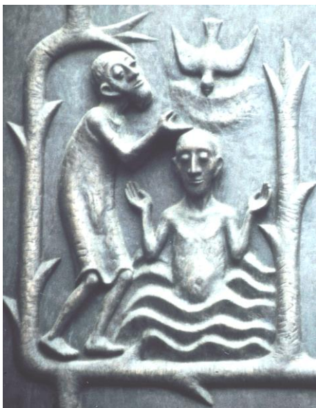
Portal St. Kunibert Köln von Toni Zenz

Für Jesus wird diese himmlische Zusage und Bestätigung zum Auftrag. Er verkündet Gottes Frohe Botschaft in Wort und Tat.