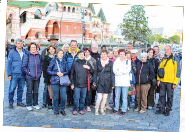
Die Teilnehmer der Moskaureise.

Die 21 Teilnehmer aus Schönau am Königssee, verstärkt durch einen Ramsauer, bereisten vom 27. Mai bis 3. Juni 2017 Moskau und „den Goldenen Ring“ mit seinen altrussischen Städten und orthodoxen Klöstern.