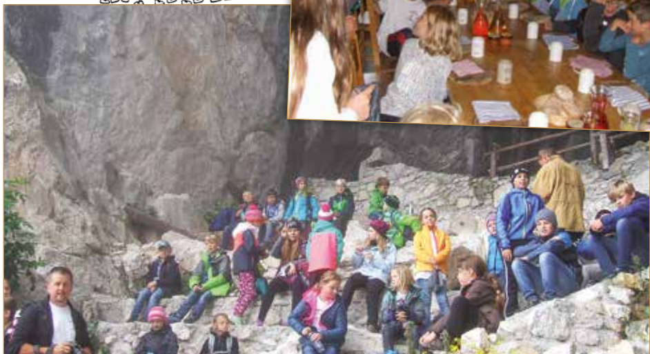
Ministrantenausflug zur Eisriesenwelt und Burg Hohenwerfen.

weggeräumt waren, begann es stark zu regnen!