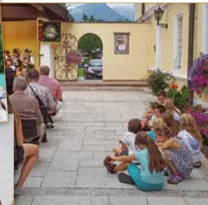
Grillfest der Ministrant/innen.