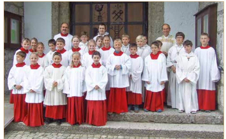
Einkleidung. Neues Gewand für die Ministranten.