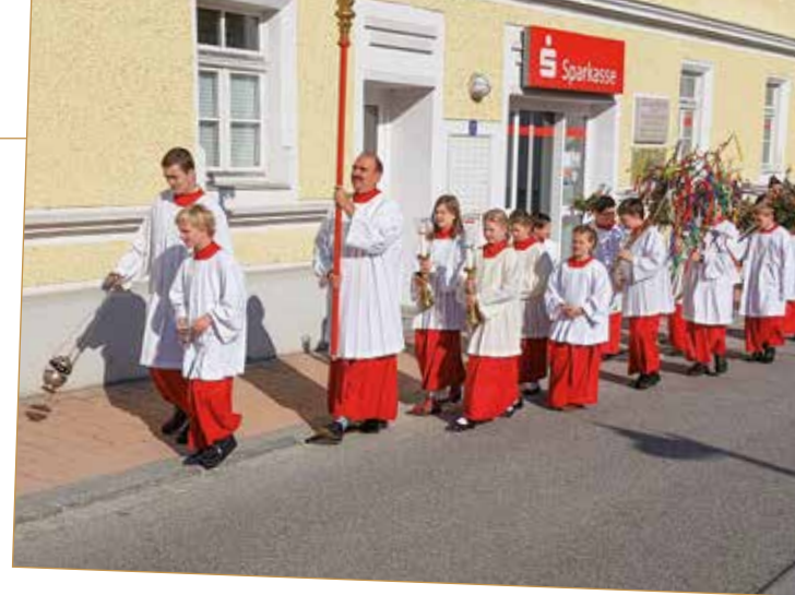
Osterzeit – Palmsonntag.