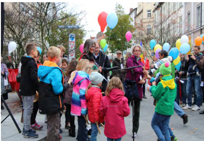
150 bunte Luftballons für den Frieden, Bild: Hubert Fackler