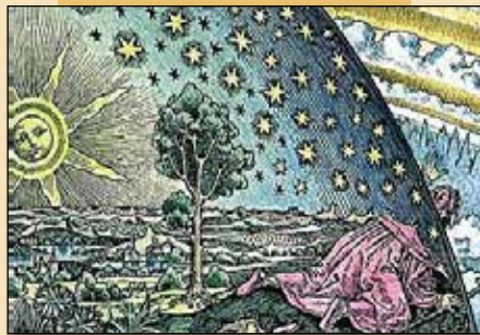
Bild: „Durchbrechung des mittelalterlichen Weltbildes“, Holzschnitt, 1888