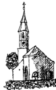
Pfarrei St. Stephan Paunzhausen