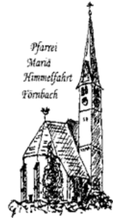
Pfarrei Maria Himmelfahrt Förnbach