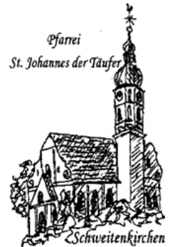
Pfarrei St. Johannes der Täufer Schweitenkirchen