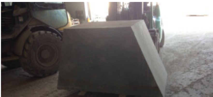
Altar im Rohschnitt