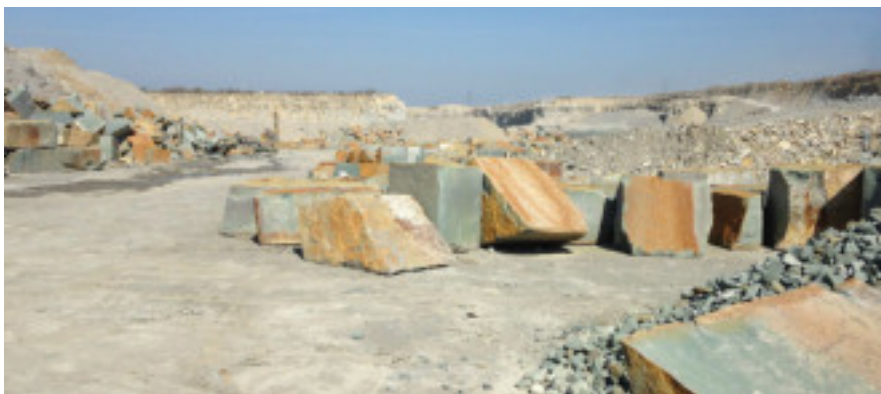
Steinbruch in Anröchte, aus dem das Material der liturgischen Orte stammt