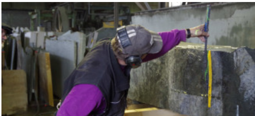
Tabernakel vor dem Ausschnitt für die Tür