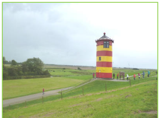
Der Leuchtturm in Pilsum, bekannt aus dem Film „Otto – Der Außerfriesische“ von und mit dem Komiker Otto Waalkes

Nach einem lustigen Abend mit bayrischer Gemütlichkeit und freundschaftlichen Verbindungen zur niedersächsischen kfd Gruppe, wurde mit bleibenden Eindrücken die Heimreise angetreten.