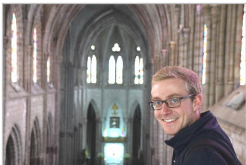
Auf der Empore der Basilika „Voto Nacional“ in Quito.

sich direkt im Centro Pastoral „Maria, Madre de la Misericordia“.