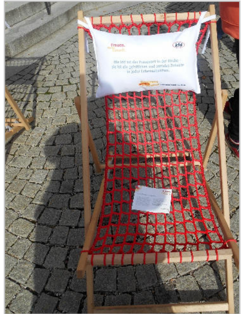
Begegnungstag in Ebersberg: Ein Netz das Frauen trägt!

Dass die kfd wirklich ein Netz ist, das Frauen trägt, und nicht nur stärkster deutscher Frauenverband ist, kam beim Begegnungstag in Ebersberg zum Ausdruck. „Uns geht