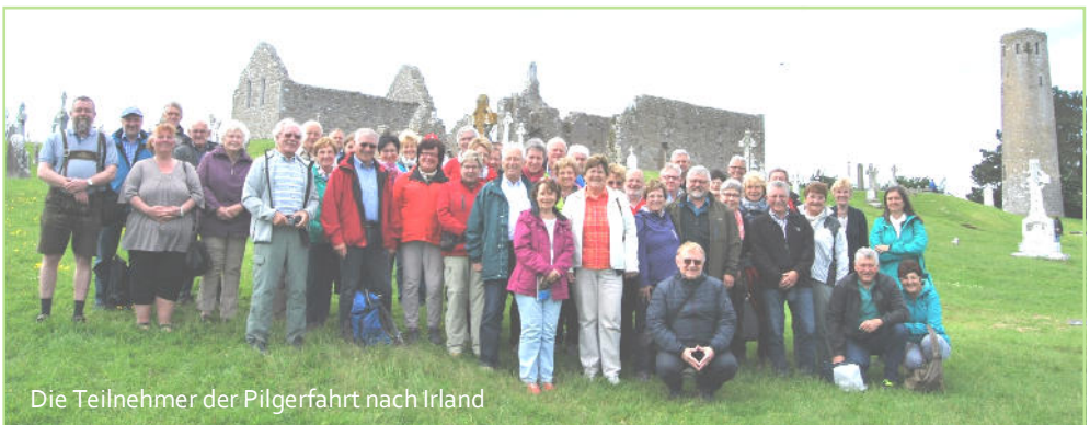
Die Teilnehmer der Pilgerfahrt nach Irland