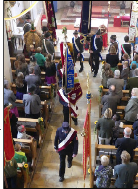
Die Fahnenabordnungen der Ortsvereine beim Erntedankfest.