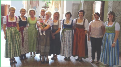
Der Stephanschor bei einer Tauffeier.