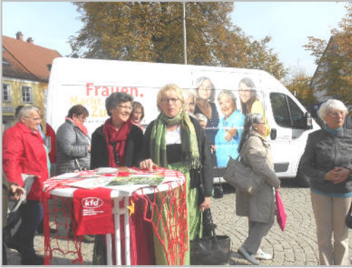
Frauen aus Surheim in Ebersberg

und legal bezahlte haushaltsbezogene Dienstleistungen, hautverträgliche Kosmetika, Lebensumbrüche und Spiritualität. Eröffnet wurde der Tag mit einem Impulsreferat: „Starke Stimmen – unüberhörbar“. Anschließend waren die Mitglieder eingeladen, sich an einem Workshop zu beteiligen.