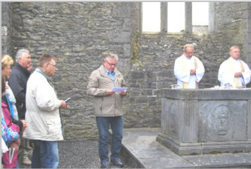
Gottesdienst in den Ruinen des Klosters Aghaboe, dessen Abt einst der spätere Bischof Virgilius von Salzburg war.