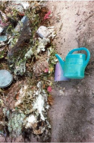
Ein wildes Durcheinander von Gartenabfällen, Pflanzgefäßen und Plastikmüll am Friedhof in Surheim!

Die Kirchenverwaltung Surheim bittet um Beachtung: