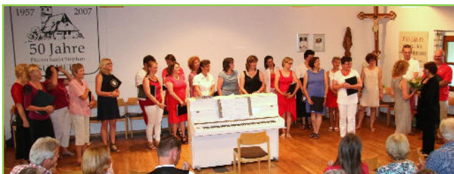
Beim Gemeinschaftskonzert mit dem „Rund ums Jahr Chor“ aus Ebenau.

Ein besonderer Höhepunkt war das gemeinsame Singen im Pfarrheim in Surheim mit Freunden, dem „Rund ums Jahr Chor“ aus Ebenau. Zu ihrem 5-jährigen Jubiläum war der Stephanschor nach Ebenau eingeladen und hatte gemeinsam mit weiteren Chören einen wunderschönen Konzertabend gefeiert.