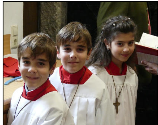
Auch die Ministranten trugen zum Gelingen des Erntedankfestes bei.