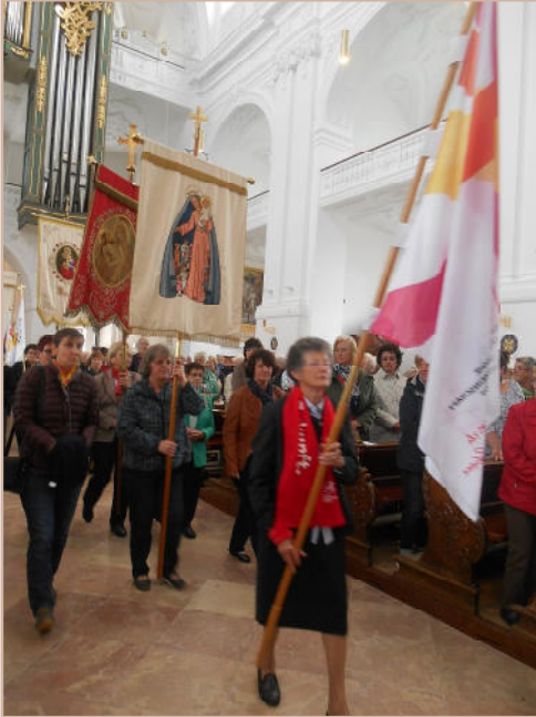
Einzug der Fahnen in die Basilika bei der Sternwallfahrt in Altötting

Der Diözesanverband München-Freising begeht seine alljährliche Wallfahrt Anfang Oktober nach Altötting. Auch die katholische Frauengemeinschaft aus Surheim beteiligte sich daran.