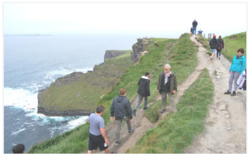
Eine beeindruckende Landschaft. Die „Cliffs of Moher“, wo das Land 200 Meter direkt ins Meer abfällt.

https://www.erzbistum-muenchen.de/Pfarrei/PV-Saaldorf-Surheim/cont/8385