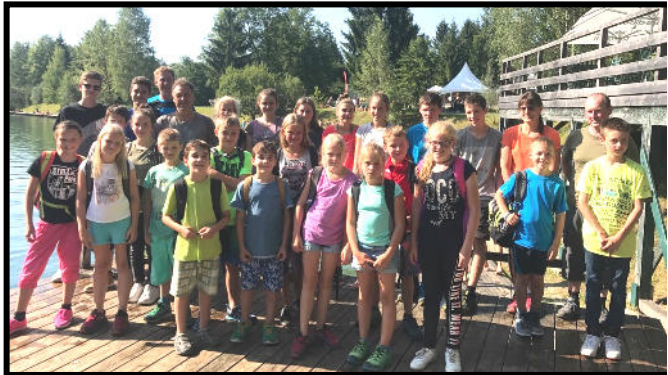
Die „Minis“ aus Saaldorf und Surheim beim wohlverdienten Ausflug nach Anif

Am 6. August war es dieses Jahr endlich wieder soweit und wir, die Saaldorfer und Surheimer Minis brachen zu unserem Ausflug in den Klettergarten nach Anif auf.