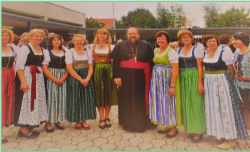
Nach der Firmung: Die Chormitglieder zusammen mit Weihbischof Wolfgang Bischof.

Im Juni spendete Weihbischof Wolfgang Bischof die Firmung in Freilassing. Der Stephanschor Surheim gestaltete musikalisch den Festgottesdienst gemeinsam mit Peter Voitza an der Orgel.