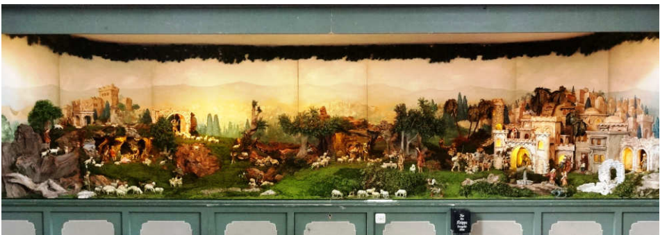
Gesamtansicht der Landschaftskrippe unter der Empore der alten Pfarrkirche