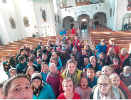
Selfie der „Ebenbilder Gottes“