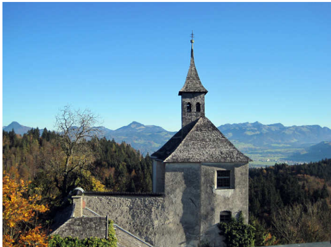
Blick vom Turm auf Kirche und Geigelstein

Vielen Dank Bruder Konrad für das Gespräch!