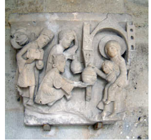
Anbetung der Könige, Kapitelsaal St. Lazare, Autun