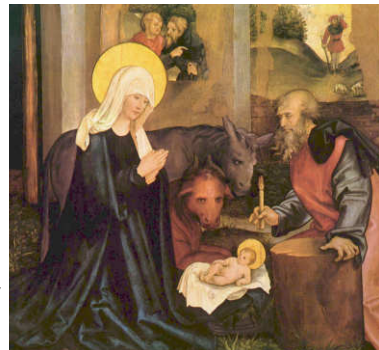
Hans Schäufelein, Geburt Christi, 1506/07