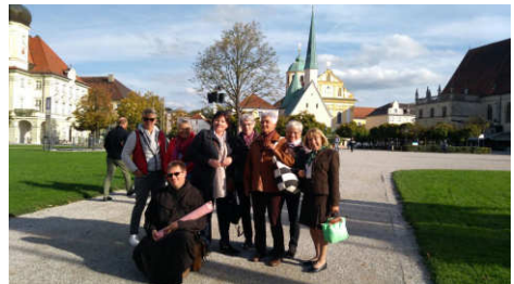
Die Gruppe vor der Stiftskapelle

dürfte. Hier wurde der Legende nach der erste bayerische Herzog getauft und hier fand die um 1330 aus Lindenholz geschnitzte, etwa 70 cm hohe Muttergottes mit dem Kinde ihre Heimat. Ab 1488 wurde das Gnadenbild Ziel unzähliger Wallfahrer, die dort ihre Sorgen und Nöte vor die Heilige Maria mit dem Jesus-Kind getragen haben und erhört wurden, wie die 2000 Votivtafeln rund um die Kapelle eindrucksvoll bezeugen. Leider war die Kapelle am Vormittag sehr voll, aber wir konnten uns vor unserer Heimfahrt noch einmal zu einem stillen Gebet versammeln und in Ruhe diese heilige Stätte genießen sowie die bedeutenden Kunstschätze bewundern, die sie beherbergt : den ganz in Silber getriebenen Schmuck des Gnadenaltars aus dem 17. Jahrhundert, den rechts vom Altar knieenden „Silberprinz“ und