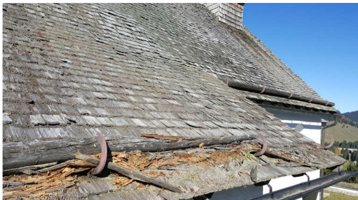
Die Schäden sind deutlich zu erkennen.