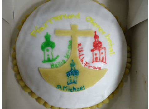
Lenis Kuchen mit dem Pfarrverbands-Logo