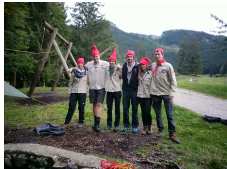
Unsere sechs Leiter nahmen teil. Mit Zwergenmützen wurden die jeweiligen Posten begrüßt

Frasdorfer Hütte mit dem ersten Posten los. Dort konnten Brückenbau- und Knotenkünste unter Beweis gestellt werden. Am Samstag in der Früh machten wir uns schon um fünf Uhr bei Nebel, Regen und Dunkelheit zu den ersten Posten auf, wo uns viele verschiedene Themen