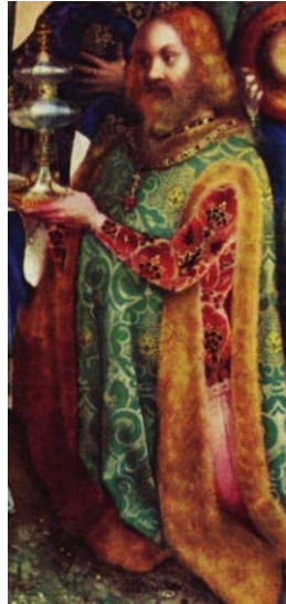
Links und S. 32: Ausschnitte aus dem Dreikönigsaltar von Stefan Lochner, um 1445, Köln

Der dritte Herr ist auch recht fein. Sei' Heimat muss im Osten sein. Aus Seide und aus Purpur-Samt trägt er a b'sonders kostbar's G'wand. Zu ihm g'hörn Leut', a ganze Schar, reiten Kamel und Dromedar. Er lasst' se in 'ra Sänft'n trag'n. Er woass' fast all's auf alle Frag'n. Und mit sein'm Wissen hat er 'braut a'n Myrrhenbalsam für die Haut. Den bringt er als sei' Gabe mit. Als Zeichen, dass er will den Fried'.