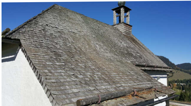
Das Wetter in den Bergen ist rau.