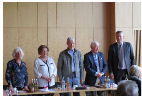
Der wiedergewählte Vorstand