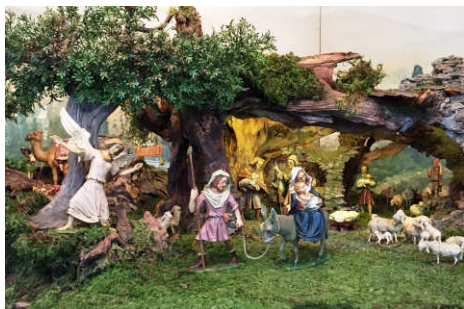
Darstellung der Flucht nach Ägypten

Diese alte Krippe war Eigentum verschiedener Personen, die sich ihre Figuren zurückholten, als sich niemand mehr fand, die Krippe unter dem Chor in der Pfarrkirche aufzubauen.