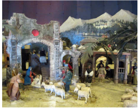
Die Krippe kann ganzjährig besucht werden.

Gott wird Mensch! Heiligabend sind so viele Leute hier da den ganzen Tag! Es ist was Wunderschönes mit so vielen Menschen Weihnachten zu feiern. Das hält bei mir so an, das geht bei mir so tief! Versuchen wir so zu leben wie Gott es uns gezeigt hat, liebt einander, vergebt einander, das ist Weihnachten!