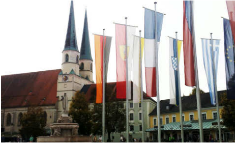
Die Stiftskirche in Altötting