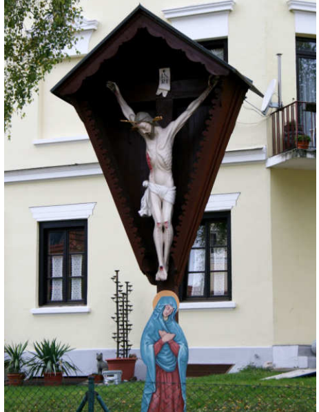
Kiefersfelden Bahnhofstraße 8