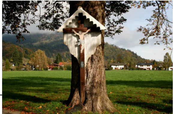
An der Bad-Trißl-Straße

Hier ist eine Auswahl der Weg- bzw. Flurkreuze in unserem Pfarrverband dokumentiert. Früher wurden sie als Zeichen des Glaubens aufgestellt, beim Vorübergehen bekreuzigten sich die Wanderer, oder beteten davor. Manche wurden zur Erinnerung an einen Unglücksfall aufgestellt, nach dem Weltkrieg auch aus Dankbarkeit für die Heimkehr. Heute findet man Kreuze oft