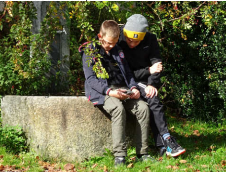
Konzentrierte Überlegung am Smartphone