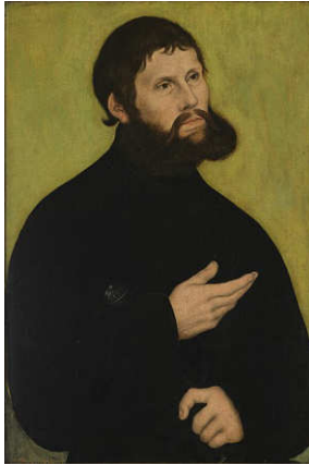
Luther als Junker Jörg, von Lukas Cranach d. Ä. 1522

Vor 500 Jahren hat Martin Luther am 31. Oktober 1517 die 95 Thesen an die Schlosskirche zu Wittenberg angeschlagen. Dieser Tag gilt als der Beginn der Reformation. 1521 übersetzte er in nur elf Wochen auf der Wartburg bei Eisenach das Neue Testament ins Deutsche. Im weiteren Verlauf kamen noch Teile aus dem Alten Testament dazu.