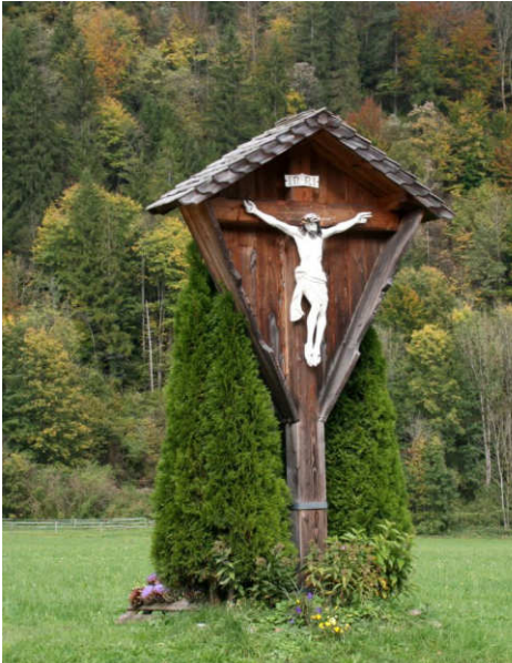
Niederaudorf Tatzelwurmstr. Agg