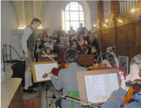
Proben letzter Feinheiten

Zum Patrozinium, dem zweiten Kieferer Fest am 17. September, sang der Kirchenchor Heilig Kreuz Kiefersfelden dieses Jahr die Orgelsolomesse in C-Dur von Wolfgang Amadeus Mozart.