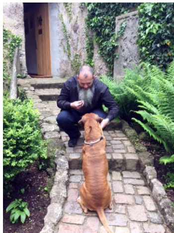
Jeder ist willkommen!