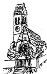
Kuratie St. Georg Dürnzhausen