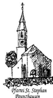
Pfarrrei St. Stephan Paunzhausen