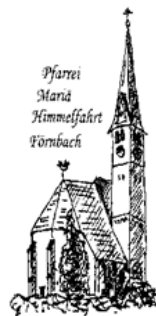
Pfarrrei Maria Himmelfahrt Förbach