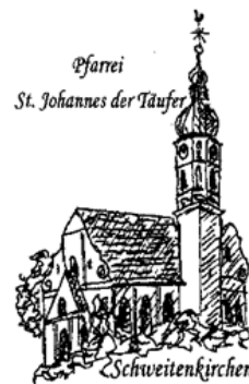
Pfarrrei St. Johannes der Täufer Schweitenkirchen