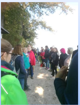
Viele Menschen wollten Jesus sehen, also stieg er in ein Boot und erzählte ein Gleichnis:

Gott lässt auch uns in der Not nicht allein. „Herr, höre unser Gebet!“