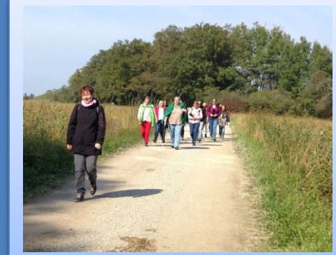
Zurück zur Nikolauskirche in Übersee: „Da begegnet mir einer, es öffnet sich ein Stück Himmel auf Erden und jeder geht beschenkt seinen Weg.“

Gott lässt auch uns in der Not nicht allein. „Herr, höre unser Gebet!“