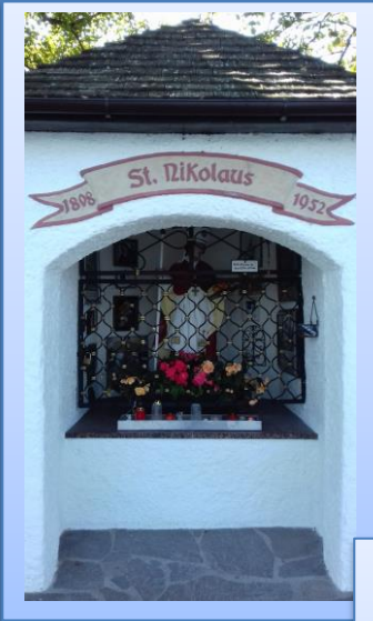
Die Nikolauskapelle wurde zum Dank für die Rettungserfahrungen aus Seenot gebaut.