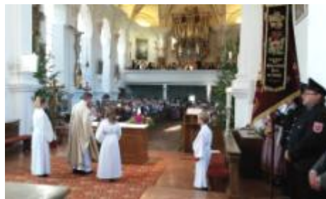
Blick ins Kirchenschiff beim Festgottesdienst um 8.00Uhr