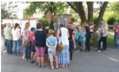
Beginn der Kinderandacht am Kreuz vor der Kirche