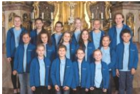
Eine kleine Gruppe des Chores präsentiert das neues Chor-Outfit