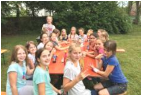
Beim Zeltlager im Bucher Pfarrgarten zum Abschluss der Chorsaison