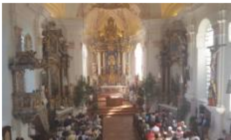
Blick von der Empore beim Festgottesdienst um 10.00 Uhr