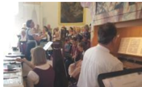
Kirchenchor beim Festgottesdienst um 10.00 Uhr