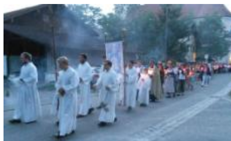
Lichterprozession zum Abschluss des Tages