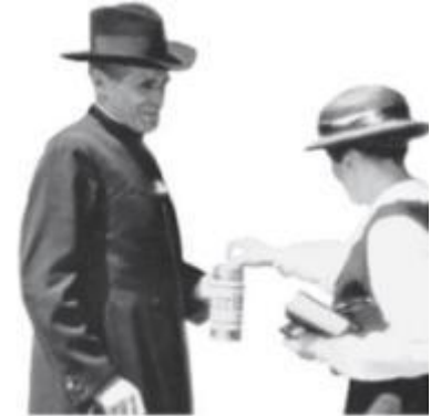
Jesuitenpater Rupert Mayer, Patron der Caritas im Erzbistum, sammelte schon 1935 mit der Caritas-Büchse vor St. Michael in der Münchner Fußgängerzone.

Alle Sammler/innen an den Haustüren sind im Auftrag der Pfarrei unterwegs und können sich ausweisen. In manchen Pfarrgemeinden oder einzelnen Straßenzügen werden auch Sammlungsbriefe eingeworfen.