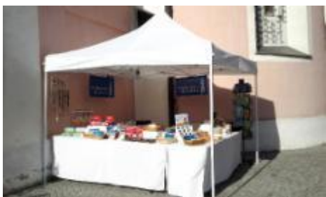
Wallfahrtsladen vor der Pfarr- und Wallfahrtskirche