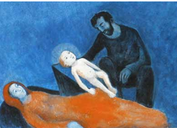
Foto: Friedbert Simon / Künstler: Polykarp Uhlein In: Pfarrbriefservice.de

Wann glauben Sie? Oder anders gefragt: Wann hat der Glaube Bedeutung für das, was Sie tun? Ich glaube, dass es im Leben sehr vieler Menschen solche Punkte gibt: Am Beginn und am Ende des Lebens, zu herausragenden Ereignissen wie Erstkommunion, Firmung und Hochzeit, vielleicht auch ganz einfach am Sonntag. Es ist gut, dass es diese Punkte gibt, die über das Getriebe des Alltags hinausreichen, an denen wir um den Schutz und den Segen Gottes bitten.