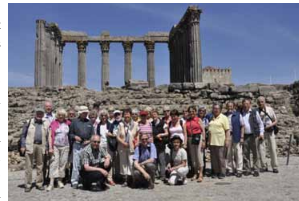
Vor dem römischen Tempel in Evora

Voller Begeisterung über das besuchte Land und die Menschen dort ist die Reisegruppe des Pfarrverbandes am 09.05.2017 aus Portugal zurückgekehrt. In acht Tagen hatten wir die Gelegenheit, das kleine Land zu bereisen und seine unzähligen Kirchen, Klöster, Burgen, antiken, archäologischen Stätten in einer einmalig schönen Landschaft zu bewundern. Der geistliche Höhepunkt war der Besuch in Fatima mit der Feier der hl. Messe und