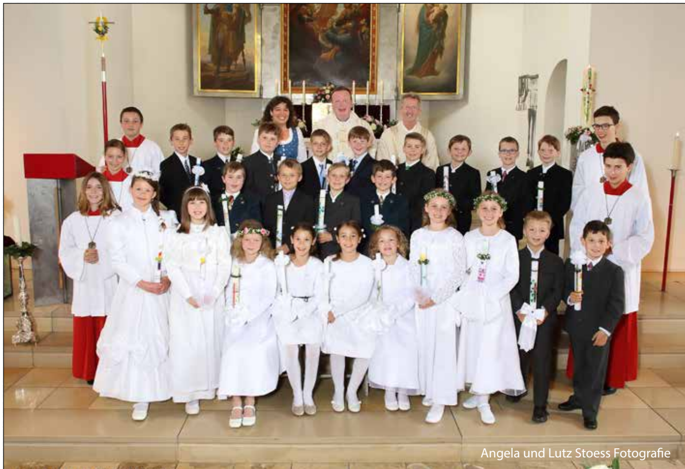
Angela und Lutz Stoess Fotografie