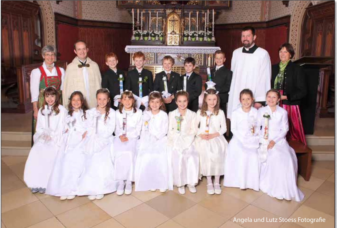
Angela und Lutz Stoess Fotografie