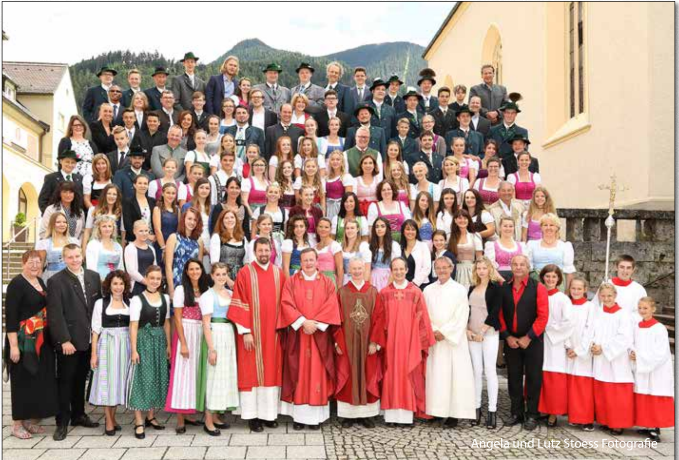
Angela und Lutz Stoess Fotografie