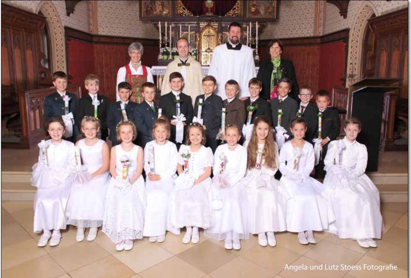
Angela und Lutz Stoess Fotografie