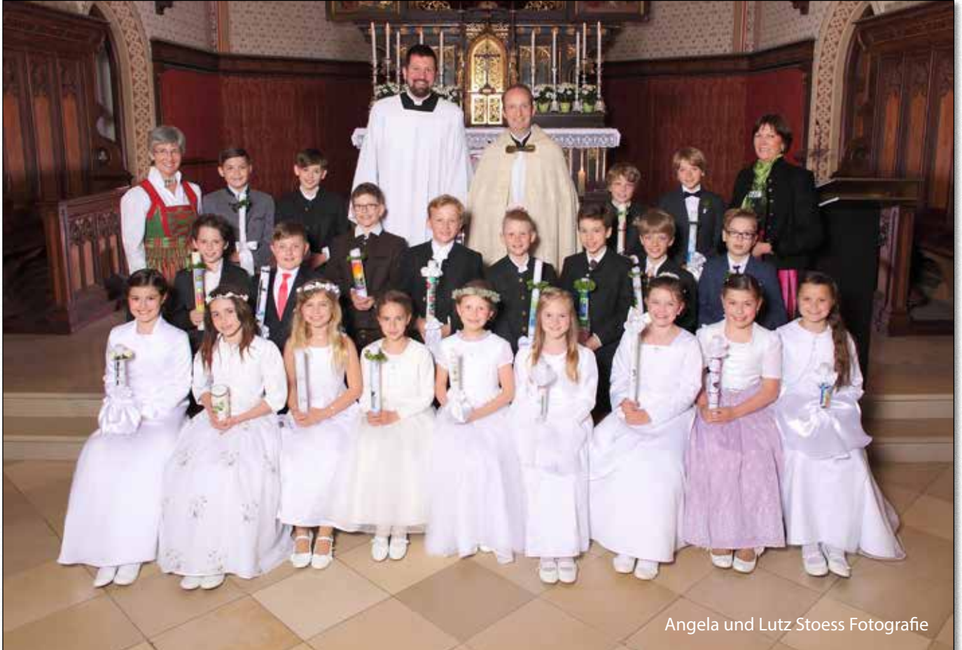
Angela und Lutz Stoess Fotografie