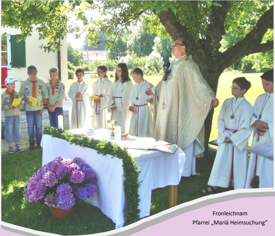
Fronleichnam Pfarrei „Mariä Heimsuchung“