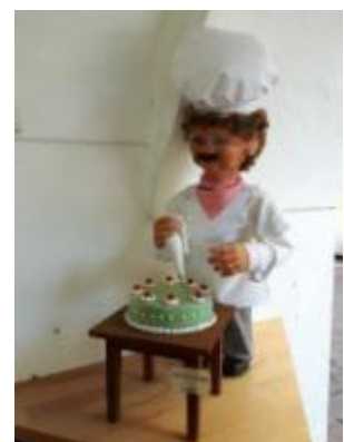
Wer findet diesen Konditor in Landshut?