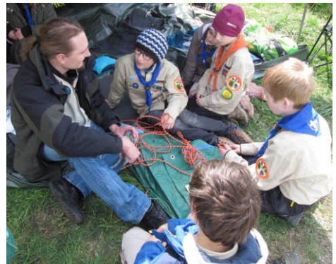
oben: Wer kennt die Knoten?