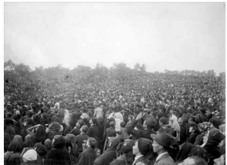
Die Menschenmenge am 13.10.1917

Das letzte Mal erschien Maria am 13. Oktober. Da sich die Erscheinungen herumgesprochen hatten, kamen dieses Mal viele zehntausend Menschen auf das Feld. Es waren nicht nur Gläubige, sondern auch Zweifler und Naturwissenschaftler und ganz einfach Neugierige. Sie wurden Zeugen eines bis heute nicht geklärten Naturereignisses. Die Sonne tanzte in kreisenden und Zick-Zack-Bewegungen und sandte farbige Strahlen aus. Die nasse Kleidung von