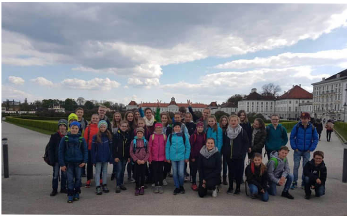
Alle teilnehmenden Ministranten vor dem Museum „Mensch und Natur“

Aus den vier Pfarreien waren insgesamt 39 Ministranten, aufgeteilt auf acht Gruppen quer durch München unterwegs. Ziel des Spieles war es, dass eine der Gruppen (=Mr. X) in München gefunden wird, hierzu aber nur mit den öffentlichen Verkehrsmitteln gefahren werden durfte. So trafen wir uns gleich in der Früh am Rosenhei-