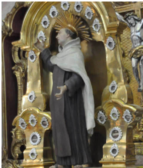
Figur des Johannes in Reisach

den einen geachtet, von anderen verfolgt und verleumdet. 1726 wurde er heilig gesprochen, 1926 zum Kirchenlehrer und 1952 zum Patron der spanischen Dichter ernannt.