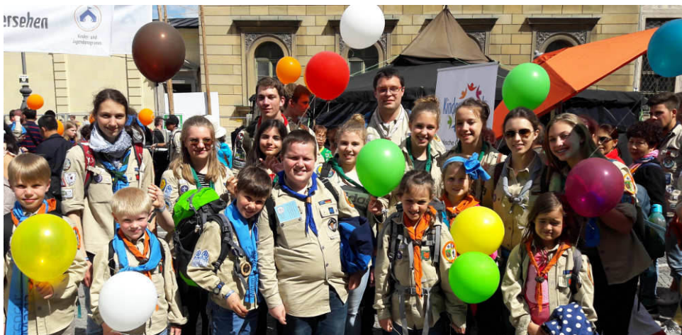
Beim Marienjubiläum in München