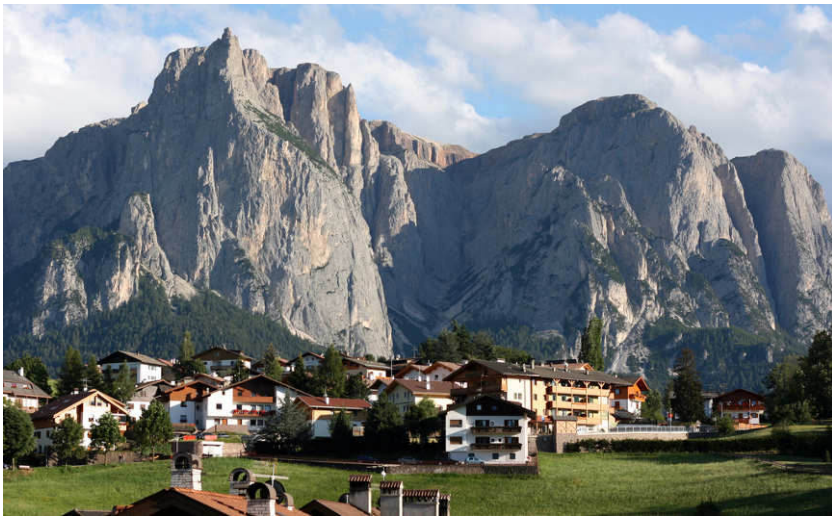
Kastelruth, das Ziel des Tagesausflugs

Die Kirchtürme gehören zu: 1 Heilig Kreuz; 2 Ev. Auferstehungskirche; 3 St. Michael; 4 Zu Unserer Lieben Frau; 5 Ev. Erlöserkirche; 6 Alte Pfarrkirche Heilig Kreuz; 7 St. Josef, Wall; 8 St. Theresia und St. Johannes, Reisch. Welcher Kirchturm fehlt?