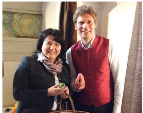
Ostereier zum Dank