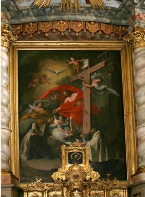
Hochaltarbild der Klosterkirche Reisach mit den Ordensgründern Teresa und Johannes

Aufstieg auf den Berg Karmel massiv begegnet. Gemeint ist nicht Weltverachtung, nicht Verneinung oder „Abtötung“ natürlicher Triebkräfte.