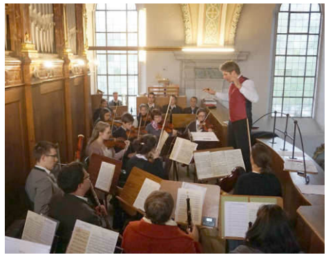
Konzentrierter Einsatz der Musiker

Probentermine: Jeden Montag von 20 bis 22 Uhr im Pfarrheim. Die erste Probe nach der Sommerpause ist am 14. August.