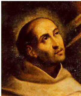
Johannes vom Kreuz, Bildausschnitt, 17. Jh.

Die Zukunft der Schöpfung besteht im vollendeten „Reich Gottes“, in der vollkommenen Beziehung der Menschen zu Gott, zueinander und zu allen Geschöpfen.