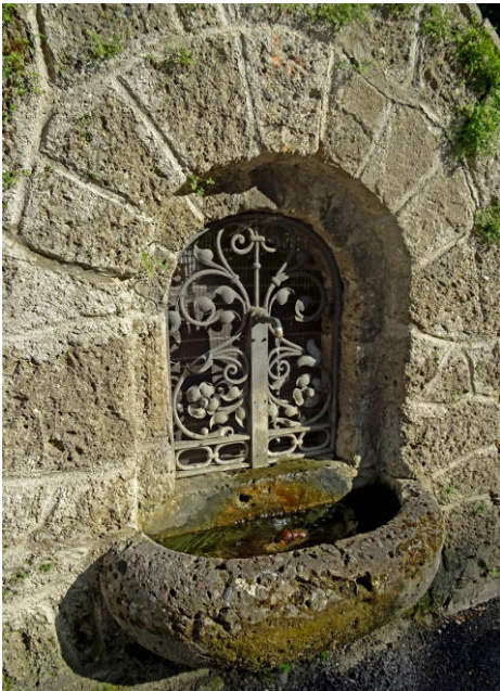
Ein Brunnen in Kiefersfelden

Da kann es passieren, dass ich im Moment tiefster Verlassenheit auf einmal spüre, wer ich WIRKLICH bin, dass ich bedingungslos geliebt bin, dass mein Wesen Liebe ist und meine einzige wichtige Aufgabe in dieser Welt darin besteht diese Liebe zu SEIN und zu LEBEN. Das ist das Einzige das meine Seele zutiefst satt macht. Das Einzige das den Lebenshunger in mir stillt.