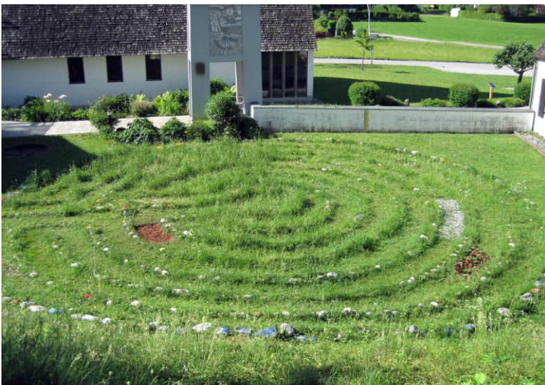
Das Labyrinth bei der Evangelischen Kirche in Oberaudorf

Ich bin überzeugt, dass Kirche unserer Zeit auf die Menschen hören muss, mit denen sie zu tun hat. Ich bin dankbar, dass es noch so viele Menschen gibt, die zu uns kommen und bei uns Taufe oder Hochzeit feiern wollen. Oder Jugendliche, die zu uns kommen und in der Gruppe dabei sein wollen und sagen, macht was mit uns. Das halte ich für entscheidend, das ist aber mehr Jesus als Luther, der ja auch auf die Situationen eingegangen ist: Hochzeit gefeiert hat, wenn er bei einer Hochzeit war, Kranke geheilt hat, wenn Kranke zu ihm gekommen sind, oder Gespräche führte, wenn es dazu kam.