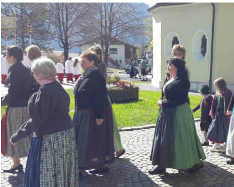
Chormitglieder an der Sebastianikapelle