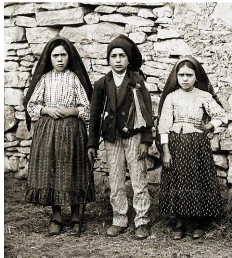
Die drei Hirtenkinder

Im 3. Geheimnis wird beschrieben, wie oberhalb der erschienenen Frau ein Engel mit einem Feuerschwert ruft: Buße, Buße, Buße!