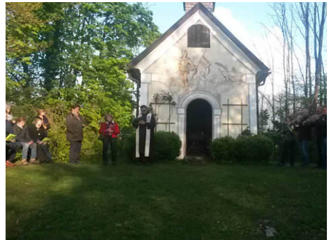
Maiandacht bei der Florianikapelle