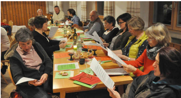
Höchste Konzentration beim Singen

Begrüßungsreden zum Ausdruck. Die aktiven Sängerinnen und Sänger des Kirchenchores mischten sich unter die zahlreich gekommenen Gäste zum gemeinsamen Gesang.