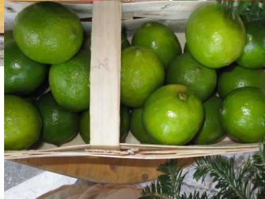
Und die Limetten für die Caipirinha