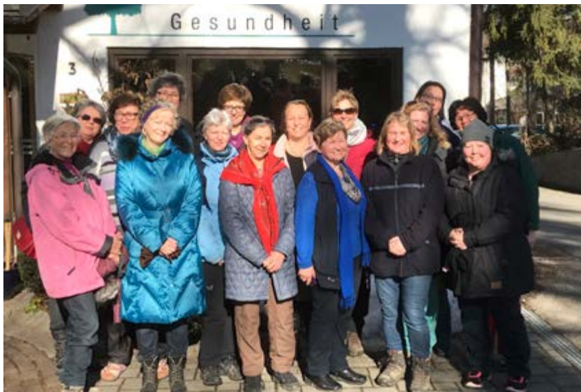
Abschalten auf den Wohlfühltagen in Bad Tölz

nach Urschalling. Auf dem Weg hatten wir genügend Zeit zum Ratschen und Kennenlernen aller Teilnehmerinnen. Zum Mittagessen wurden wir in der „Mesner Stub'n“ in Urschalling erwartet. Gut gestärkt erhielten wir anschließend eine Führung in der Kirche St. Jakobus. Sie erlangte einen hohen Bekanntheitsgrad mit dem ungewöhnlichen Dreifaltigkeitsfresko, da hier der Heilige Geist als Frau dargestellt erscheint. Darum ranken sich viele Deutungen und Mythen. Zurück marschierten wir über Trautersdorf nach Prien. Mit einer Einkehr im Cafe Heider am