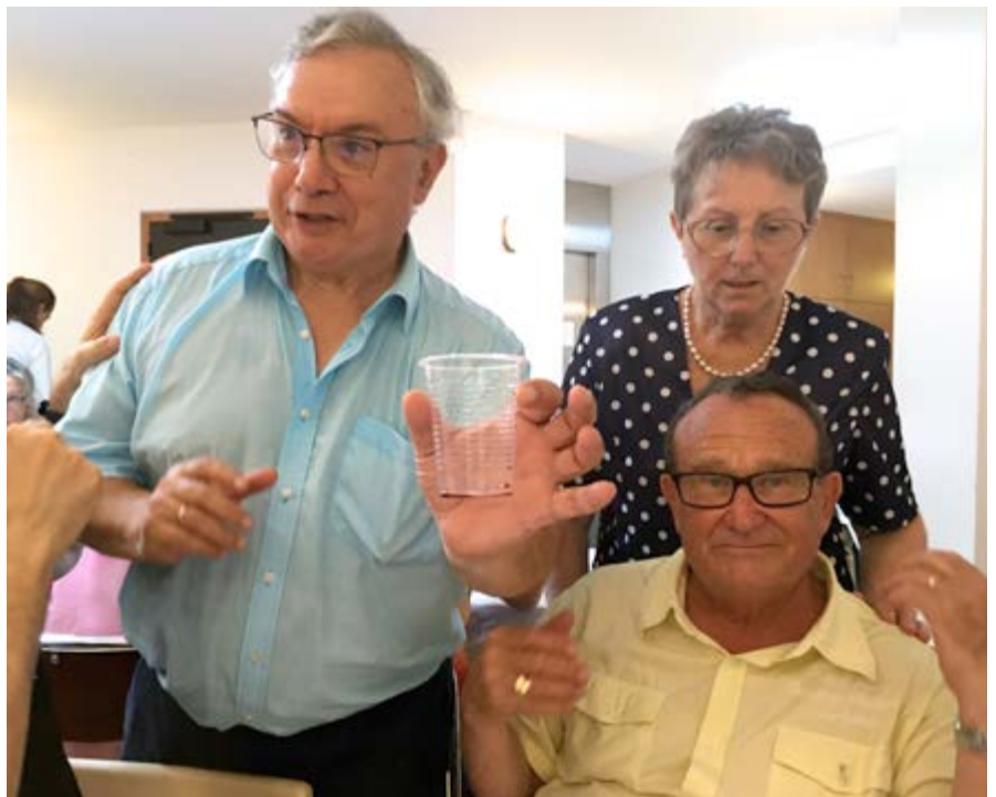
Die französischen Mitbrüder feiern mit ihren Ehefrauen