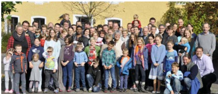
Ausbildung Ständige Diakone: Familienwochenende in Teisendorf 2016

Frauen aus dem Sprecherrat entwickelt der Fachbereich Ausbildung Ständige Diakone dieses Wochenende zu einem Geistlichen Angebot mit allen Familienmitgliedern weiter. Nach den sehr positiven Rückmeldungen 2015 äußerten sich auch dieses Mal die Teilnehmerinnen und Teilnehmer sehr angetan vom Programm und von den Inhalten.