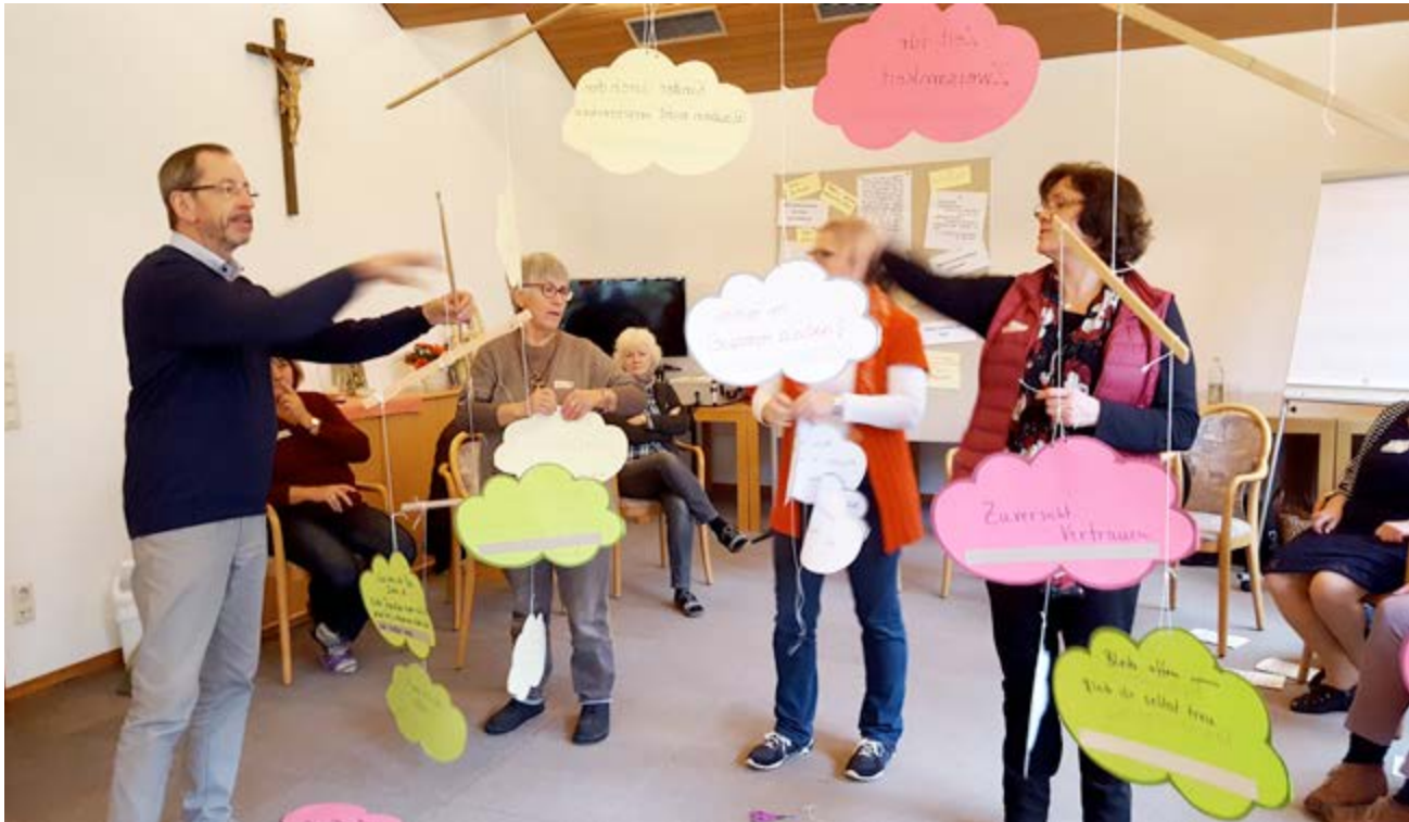
Auf dem Besinnungstag „Mein Mann betet, und ich?“

Auch 2016 war unser Programm wieder bunt gefüllt mit vielen verschiedenen Angeboten für die Ehefrauen und Witwen der Diakone bzw. die Ehefrauen der Interessenten und Bewerber.