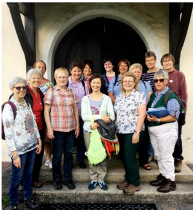
In Urschalling ist der Heilige Geist weiblich!