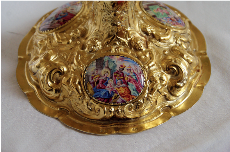
Kelch aus St. Georg, Hohenschäftlarn

Telefonische Ansage der Gottesdienstzeiten: 08178 / 9488 688