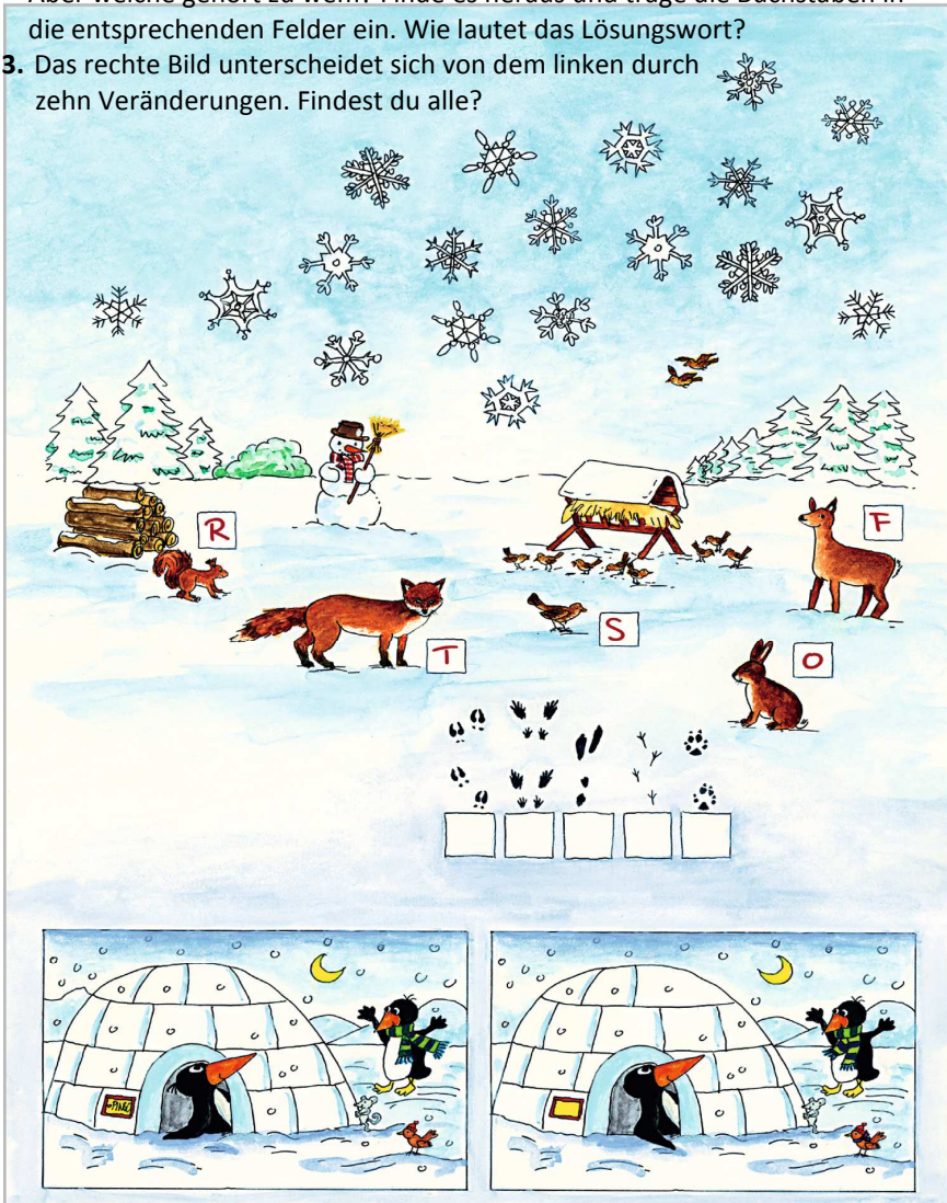
Lösungen: 1. Die Schneeflocke direkt über dem Schneemann, 2. FROST