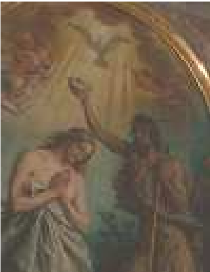
Altarbild Pfarrkirche Flossing: Johannes tauft Jesus im Jordan und ruft zur Umkehr

„Bereitet dem Herrn den Weg! Ebnet ihm die Straßen!“ - Das ist auch der Ruf an uns. Johannes der Täufer will auch uns damit aufrütteln, uns für echte