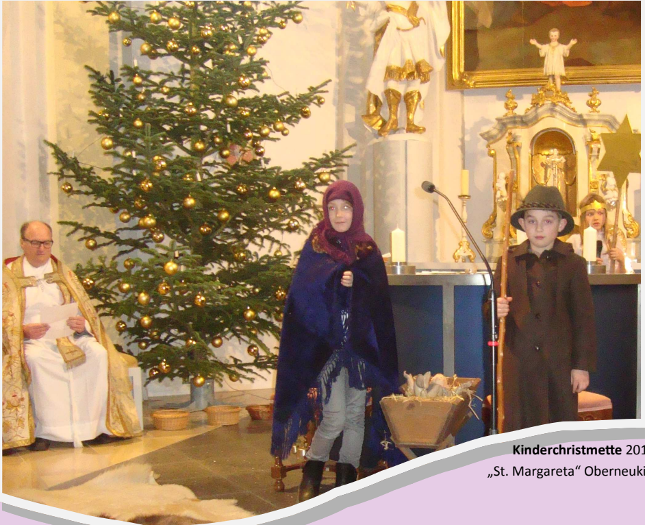
Kinderchristmette 2015 „St. Margareta“ Oberneukirchen